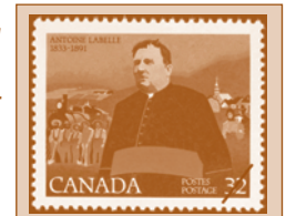
Curé Antoine Labelle, pionnier et développeur des Laurentides

À noter que les semaines sans réunion seront comblées par des sorties philatéliques : expositions, encans, samedi du timbre, visites de Club amis, etc.